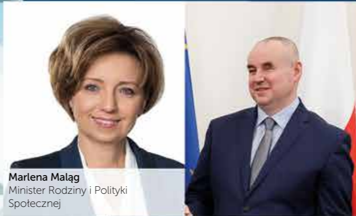
Marlena Małąg Minister Rodziny i Polityki Społecznej