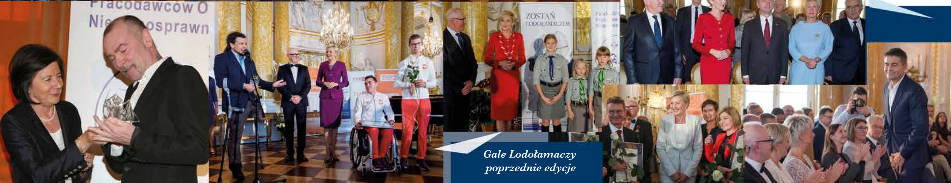
Gale Lodołamaczy poprzednie edycje