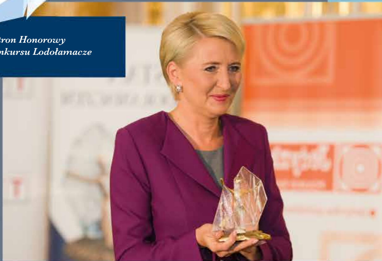
Agata Kornhauser-Duda Matżonka Prezydenta RP