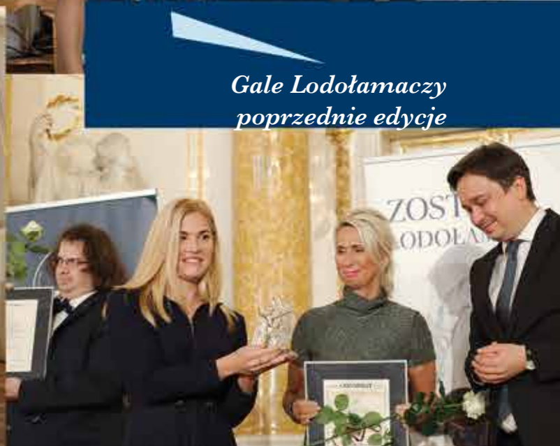
Gale Lodołamaczy poprzednie edycje