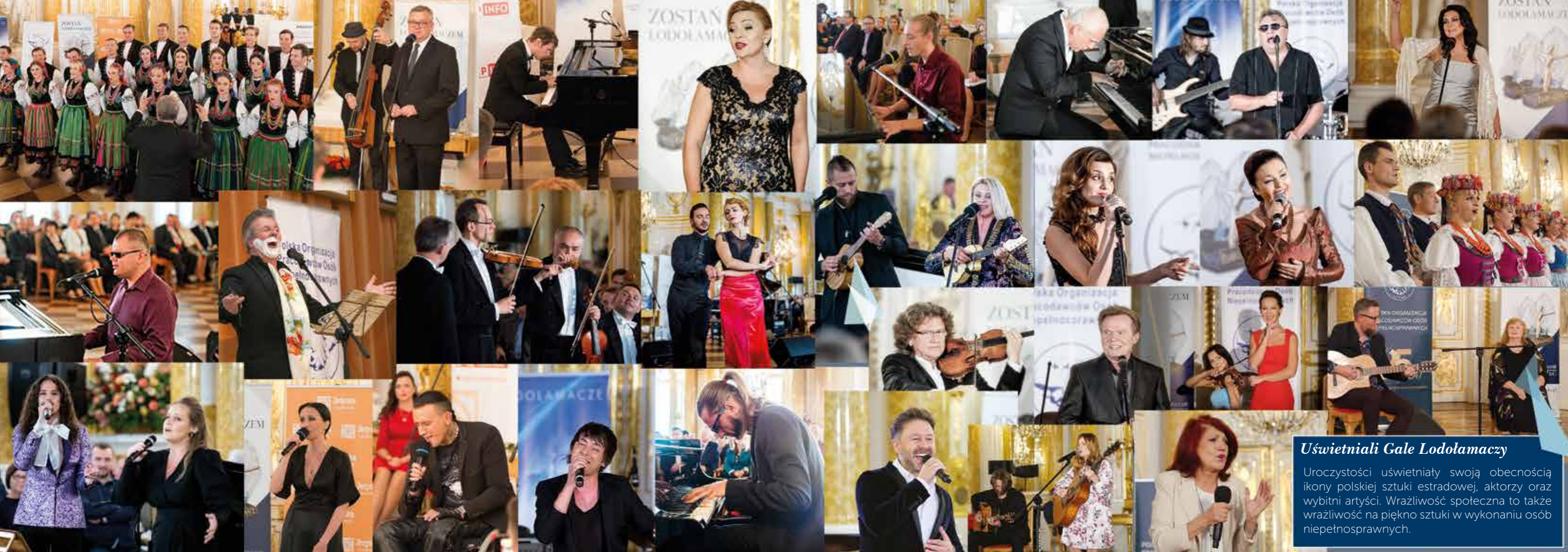
Uświetniali Gale Lodolamaczy Uroczystości uświetniaty swoją obecnością ikony polskiej sztuki estradowej, aktorzy oraz wybitni artyści. Wrażliwość społeczna to także wrażliwość na piękno sztuki w wykonaniu osób niepełnosprawnych.