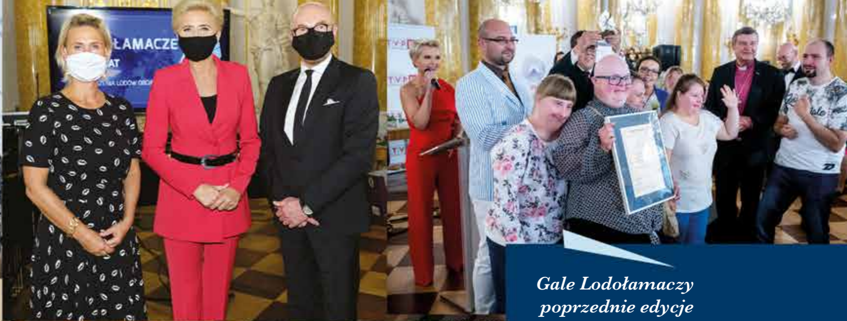
Gale Lodołamaczy poprzednie edycje