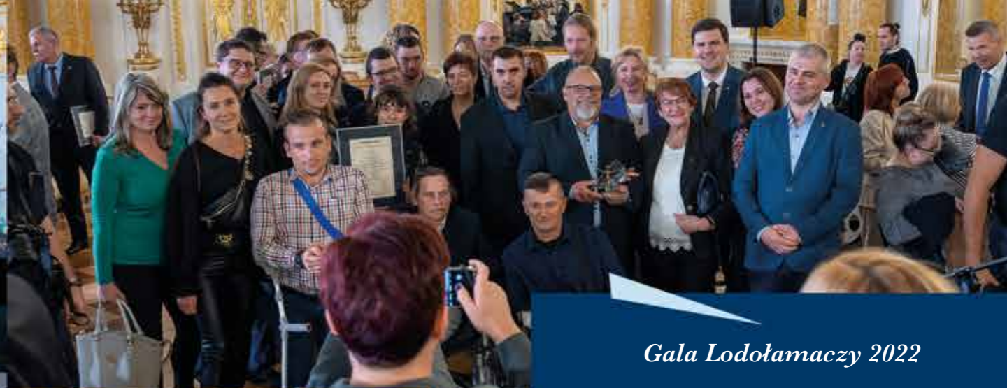
Gala Lodotamaczy 2022